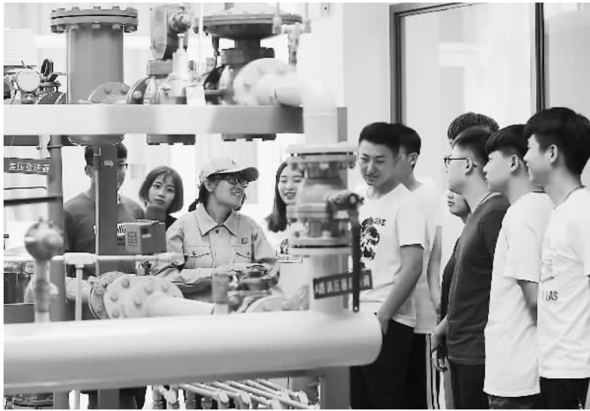
日前,北京劳动保障职业学院面向大众举办校园开放日活动,图为师生在管网运行与修复实训室上课。

针对这一问题,意见要求,要坚持以人民为中心的发展思想,适应经济转型升级、制造强国建设和劳动者就业创业需要,推行终身职业技能培训制度,大规模开展职业技能培训,着力提升培训的针对性和有效性,建设知识型、技能型、创新型劳动者大军。按照普惠均等、坚持需求导向、创新体制机制、坚持统筹推进的基本原则,建立并推行覆盖城乡全体劳动者、贯穿劳动者学习工作终身、适应就业创业和人才成长需要以及经济社会发展需求的终身职业技能培训制度,实现培训对象普惠化、培训资源市场化、培训载体多元化、培训方式多样化、培训管理规范